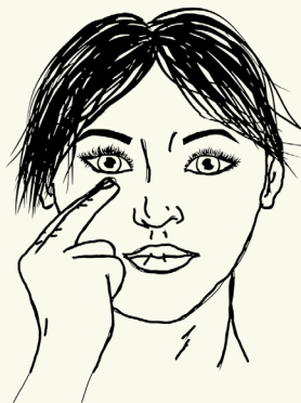
5 Onder oog Direct onder je pupil, op het bot.