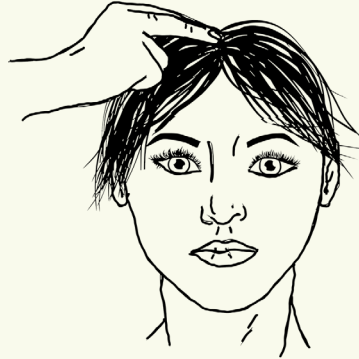
2 Op je hoofd