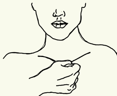
8 Sleutelbeen 2 punten: Via U-vorm sleutelbeen, kuiltje 2 cm naar beneden 2 cm naar links en rechts. Met de platte vuist (zachtjes) heb je beide punten.