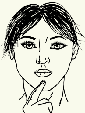
7 Onder mond Midden tussen lip en kin, kuiltje.