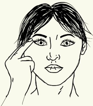
4 Zijkant oog