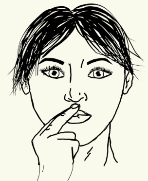
6 Onder neus Midden tussen neus en bovenlip.